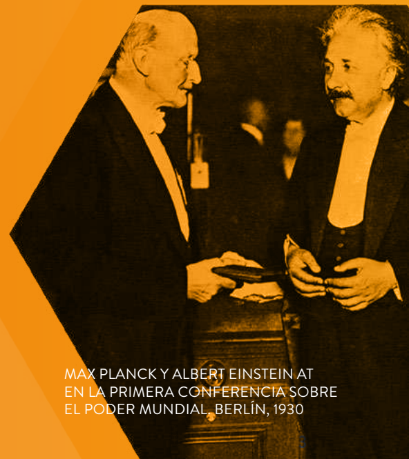
MAX PLANCK Y ALBERT EINSTEIN AT EN LA PRIMERA CONFERENCIA SOBRE EL PODER MUNDIAL, BERLÍN, 1930

EL CONSEJO MUNDIAL DE LA ENERGÍA HA ESTADO A LA VANGUARDIA DEL DEBATE ENERGÉTICO DESDE 1923.